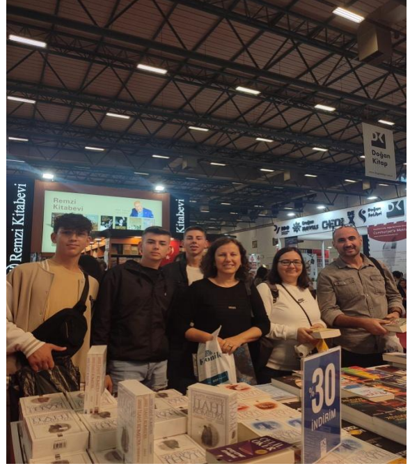
Tüyap Kitap Fuarı ve Dolmabahçe Sarayı gezimizi gerçekleştirdik.